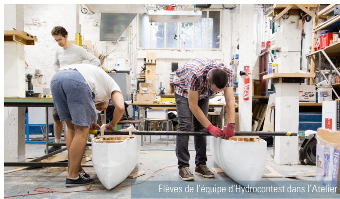
Elèves de l'équipe d'Hydrocontest dans l'Atelier

Votre don peut être défiscalisé et vous pourrez graver votre nom au cœur de l'Atelier de l'École, futur FabLab des Mines.