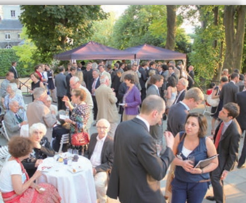
Retrouvailles sur la terrasse Vendôme