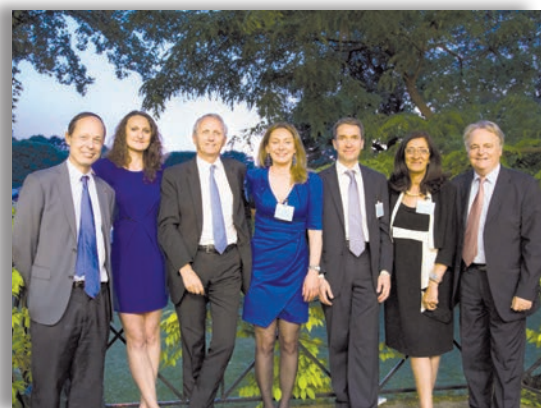
Les équipes Mécénat de l'École et de la Fondation